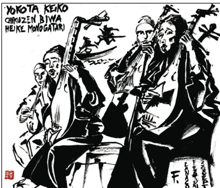
Illustration de Jean-Michel FESSOL réalisée lors de la dernière édition.

Cette flânerie débutera vendredi 27 septembre au Complexe sportif et culturel intercommunal (CSCI) à Couloisy et prendra fin dimanche 6 octobre à l'Horloge d'Ollencourt à Tracy-le-Mont.